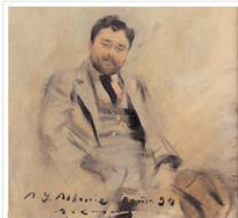
Isaac Albéniz por Ramón Casas., 1895.