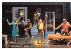
La Scala di Seta.

Cantantes y maestros del Centre de Perfeccionament "Plácido Domingo" interpretarán la farsa cómica La Scala di Seta del compositor italiano acompañados por la Orquesta de la Comunitat Valenciana.